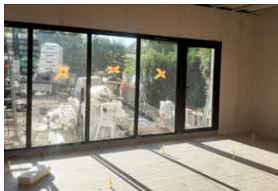
Les travaux avancent !