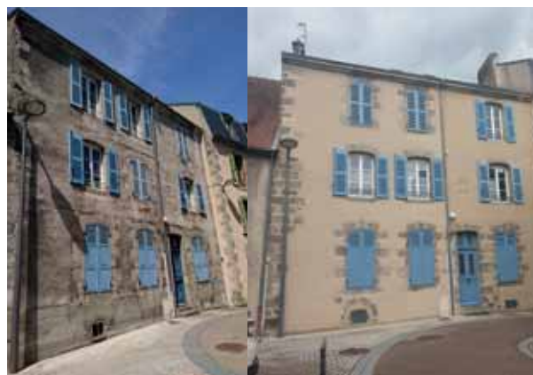
Exemple de ravalement de façade avant/après.

L'objectif fixé est de permettre le ravalement de 64 façades d'habitations privées sur 5 ans .