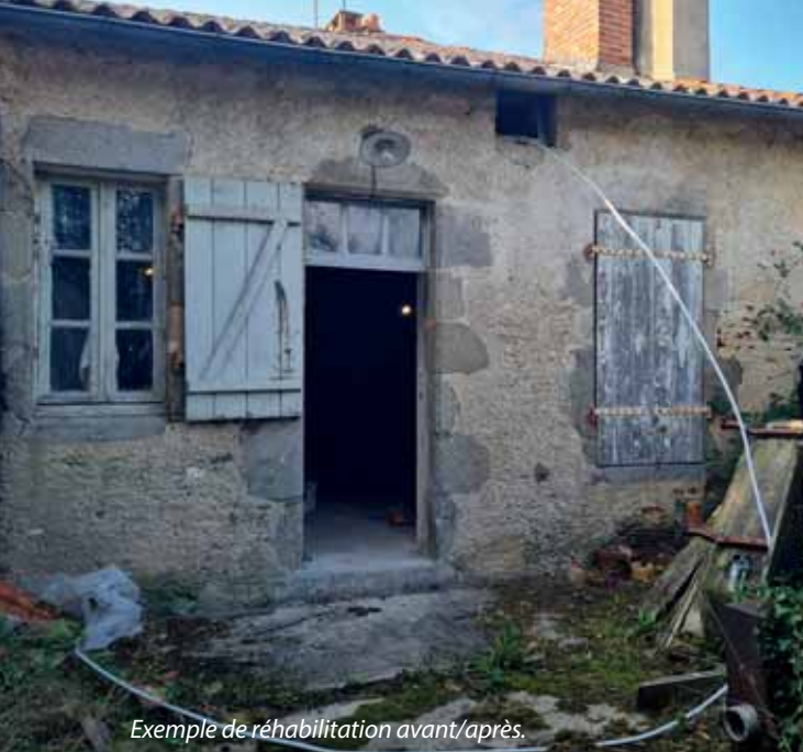
Exemple de réhabilitation avant/après.