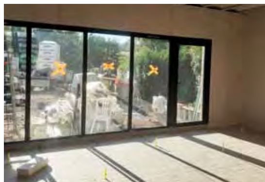
Les travaux avancent !