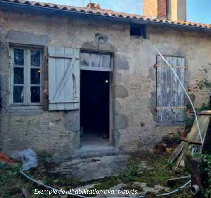
Exemple de réhabilitation avant/après.