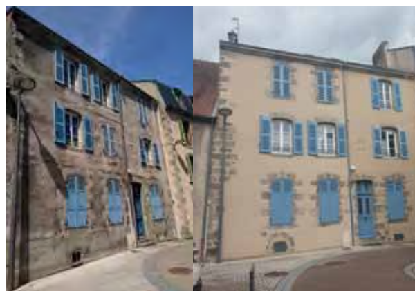
Exemple de ravalement de façade avant/après.

L'objectif fixé est de permettre le ravalement de 64 façades d'habitations privées sur 5 ans .