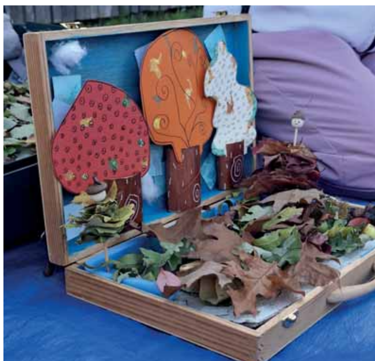
La valise surprise.